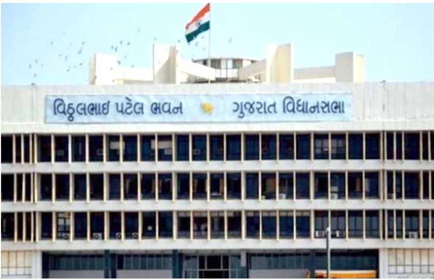
ગુજરાત વિધાનસભાએ બુધવારે રાજ્યના 'અશાંત વિસ્તાર' કાયદામાં સુધારો કર્યો છે. આ સુધારા હેઠળ, આવા વિસ્તારો હવે 'નિર્દિષ્ટ વિસ્તારો' તરીકે ઓળખાશે અને જિલ્લા કલેક્ટરો અપાયેલી સત્તા હેઠળ ત્યાં મિલકત જપ્ત કરી શકશે