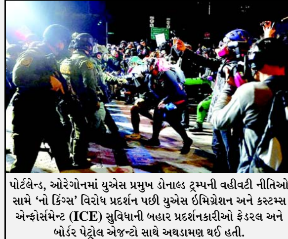
પોર્ટલેન્ડ, ઓરેગોનમાં યુએસ પ્રમુખ ડોનાલ્ડ ટ્રમ્પની વહીવટી નીતિઓ સામે ‘નો કિંગ્સ’ વિરોધ પ્રદર્શન પછી યુએસ ઈમિગ્રેશન અને કસ્ટમ્સ એન્ફોર્સમેન્ટ (ICE) સુવિધાની બહાર પ્રદર્શનકારીઓ ફેડરલ અને બોર્ડર પેટ્રોલ એજન્સી સાથે અથડામણ થઈ હતી.