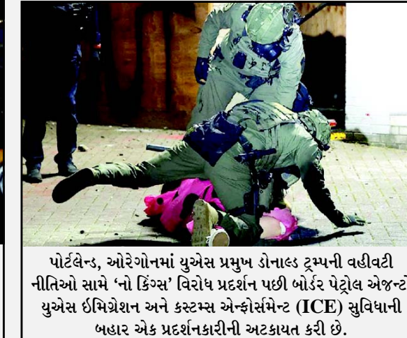
પોર્ટલેન્ડ, ઓરેગોનમાં યુએસ પ્રમુખ ડોનાલ્ડ ટ્રમ્પની વહીવટી નીતિઓ સામે ‘નો કિંગ્સ’ વિરોધ પ્રદર્શન પછી બોર્ડર પેટ્રોલ એજન્સી યુએસ ઈમિગ્રેશન અને કસ્ટમ્સ એન્ફોર્સમેન્ટ (ICE) સુવિધાની બહાર એક પ્રદર્શનકારીની અટકાયત કરી છે.