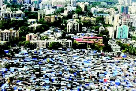
જોડાયેલા લોકો સહિત પ્લાનગી વિકાસકર્તાઓને ફાયદો પહોંચાડી શકે છે.

(એજન્સી) મુંબઈ, તા.૨૯ ધારાવીના કેટલાક ભાગોમાં લગભગ ૯૬ ટકા રહેવાસીઓને પુનર્વિકાસ પ્રોજેક્ટ સાથે જોડાયેલી મુખ્ય સર્વે યાદીમાં 'અયોગ્ય' જાહેર કરવામાં આવ્યા છે, જેના કારણે સ્થાનિકોમાં ચિંતા છે અને વિપક્ષ તરફથી તેની તીવ્ર ટીકા થઈ રહી છે. કોંગ્રેસ સાંસદ વર્ષા ગાયકવાડે ૨૭ માર્ચે લોકસભામાં આ મુદ્દો ઉઠાવ્યો હતો, અને આ સર્વે પ્રક્રિયામાં મોટા પાયે ગેરરીતિઓનો આરોપ લગાવ્યો હતો અને ચેતવણી આપી હતી કે હજારો રહેવાસીઓને તેમના ઘર ગુમાવવાનો ડર છે. તેમણે કહ્યું કે પરિશિષ્ટ-II યાદીમાં દર્શાવેલા તારણો 'આઘાતજનક' છે, જેમાં રહેવાસીઓ પૈકી માત્ર અમુક લોકોને જ પાટ જાહેર કરવામાં આવ્યા હતા.