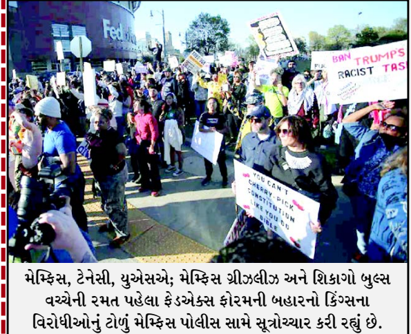
મેક્સિકો, ટેનેસી, યુએસએ; મેક્સિકો શ્રીઝલીઝ અને શિકાગો બુલ્સ વચ્ચેની રમત પહેલા ફેડએક્સ ફોરમની બહારનો કિંગ્સના વિરોધીઓનું ટોળું મેક્સિકો પોલીસ સામે સૂત્રોચ્ચાર કરી રહ્યું છે.

ઓસ્ટ્રેલિયા સુધીના એક ડઝનથી વધુ દેશોમાં પણ દેખાવાનું આયોજન કરવામાં આવ્યું હતું. આ પટનાઓનું નેતૃત્વ કરી રહેલા જુવા, ઈન્ડિવિડ્યુઅલના સહ-કાર્યકારી નિર્દેશક ઓગ્રા લેવિને એક મુલાકાતમાં જણાવ્યું હતું. બંધારણીય રાજાશહી ધરાવતા દેશોમાં, લોકો વિરોધ પ્રદર્શનોને ‘નો ટાયરન્ટ્સ’ કહે છે. રોમમાં, હજારો લોકોએ પ્રીમિયર જ્યોર્જિયા મેલોનીના ઉદ્દેશ્યથી ઉદ્ભવ ચુગોચ્યાર સાથે કૂચ કરી હતી. પ્રદર્શનકારીઓએ ઈરાન પર ઈઝરાયેલી અને યુએસ હુમલાઓનો વિરોધ કરતા બેનરો પણ લહેરાવ્યા હતા. જેમાં ‘યુદ્ધથી મુક્ત વિશ્વ’ ની હાલક કરવામાં આવી હતી. લંડનમાં યુદ્ધનો વિરોધ કરી રહેલા લોકોએ ‘જાતિવાદ સામે ઊભા રહો’ જેવા નારા લખેલા બેનરો પકડી રાખ્યા હતા. પેરિસ ફાન્સમાં રહેતા અમેરિકનોએ મજૂર સંગઠનો અને માનવ અધિકાર સંગઠનો સાથે બેસ્ટલ પાને એકઠા થયા હતા.