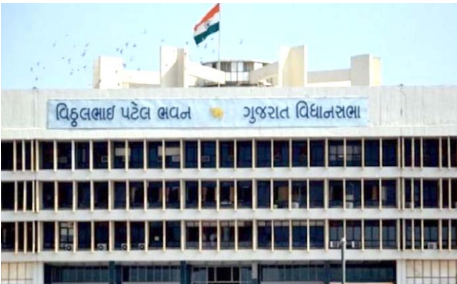
ગુજરાત વિધાનસભાએ બુધવારે રાજ્યના 'અશાંત વિસ્તાર' કાયદામાં સુધારો કર્યો છે. આ સુધારા હેઠળ, આવા વિસ્તારો હવે 'નિર્દિષ્ટ વિસ્તારો' તરીકે ઓળખાશે અને જિલ્લા કલેક્ટરો અપાયેલી સત્તા હેઠળ ત્યાં મિલકત જપ્ત કરી શકશે