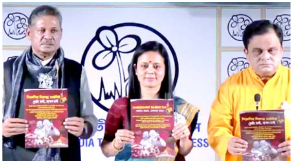
ટીએમસી નેતા મહુઆ મોઈત્રાએ પશ્ચિમ બંગાળમાં ચૂંટણી પહેલાં નવો વિવાદ ઊભો કર્યો છે.

(એજન્સી) તા.૨૯ પશ્ચિમ બંગાળમાં ચૂંટણી પ્રચાર વચ્ચે તુષ્ટમુલ કોંગ્રેસના (ટીએમસી) સાંસદ મહુઆ મોઈત્રાએ સ્વતંત્રતા યુદ્ધમાં બંગાળીઓ અને ગુજરાતીઓના યોગદાનની તુલના કરીને એક નવી ચર્ચા શરૂ કરી છે. ટીએમસી નેતાઓએ ભાજપ વિરુદ્ધ ચાજીશીટ રજૂ કરી હતી. મહુઆ મોઈત્રાએ કહ્યું કે, 'બંગાળીઓ ખૂબ જ ગૌરવશાળી જાતિ છે. અમે બ્રિટિશરો સામે સ્વતંત્રતા યુદ્ધનું નેતૃત્વ કર્યું. તેમાં કોઈ ગુજરાતીઓ હતા? ... કાલા પાણીમાં માર્યા ગયેલા અને જેલમાં પકેલી દેવામાં આવેલા લોકોના ૬૮ ટકાનામ બંગાળીઓ હતા, ત્યારબાદ પંજાબીઓ હતા. શું તમે મને એક પણ ગુજરાતીનું નામ આપી શકો છો જે ત્યાં હતો, તમારા મોટા હીરો, વીર સાવરકર માત્ર બેસીને માફી પત્રો લખતા હતા? કૃપા કરીને અમને જણાવો.'