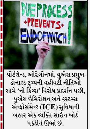
પોર્ટલેન્ડ, ઓરેગોનમાં, યુએસ પ્રમુખ ડોનાલ્ડ ટ્રમ્પની વહીવટી નીતિઓ સામે ‘નો કિંગ્સ’ વિરોધ પ્રદર્શન પછી, યુએસ ઈમિગ્રેશન અને કસ્ટમ્સ એન્ફોર્સમેન્ટ (ICE) સુવિધાની બહાર એક વ્યક્તિ સાઈન બોર્ડ પકડીને ઊભો છે.

આ આંદોલનમાં ટ્રમ્પના ઇમિગ્રેશન અમલીકરણ દબાણ, ઈરાન યુદ્ધ અને ટ્રાન્સજેન્ડર અધિકારો પાછા ખેંચવા જેવા મુદ્દાઓનો સમાવેશ થતો હતો. મિનેસોટા રેલીમાં વક્તાઓએ અબજોપતિઓની આર્થિક સત્તાની નિંદા કરી હતી