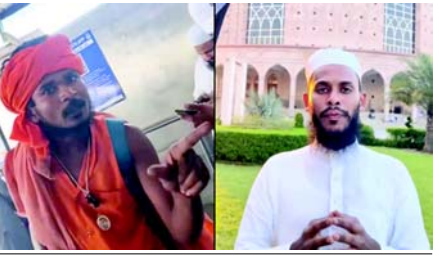
આ એક પુલ્વેઆમ ઉચ્કેરણી હતી જેથી તેઓ ગુસ્સે થાય અને કોઈ વિવાદમાં ફસાય. વિદ્યાર્થીએ અન્ય રાજ્યોમાંથી પરીક્ષા આપવા આવતા સાથી વિદ્યાર્થીઓને અપીલ કરી છે કે તેઓ સુરક્ષિત રહે અને જો કોઈ આવી રીતે ઉચ્કેરવાનો પ્રયાસ કરે તો શાંત રહીને ત્યાંથી ચાલ્યા જાય. તેણે કહ્યું, “આવા તત્ત્વો ઈચ્છે છે કે તમે ગુસ્સે થઈને વળતો પ્રકાર કરો, જેથી તમને જેલમાં મોકલી શકાય.” આ ઘટનાએ ફરી એકવાર જાહેર સ્થળો પર ધાર્મિક ઓળખના આધારે થતા ભેદભાવ અને સુરક્ષા અંગે સવાલો ઉભા કર્યા છે. હાલમાં સોશિયલ મીડિયા પર આ વીડિયોને લઈને લોકો વિવિધ પ્રતિક્રિયાઓ આપી રહ્યા છે.

(એજન્સી) નવી દિલ્હી, તા. ૨૬ દિલ્હી રેલ્વે સ્ટેશન પર એક ભગવાચારી સાધુ દ્વારા મુસ્લિમ વિદ્યાર્થીઓને નિશાન બનાવીને તેમને જાનથી મારી નાખવાની ધમકી આપવાનો કિસ્સો પ્રકાશમાં આવ્યો છે. આ ઘટનાનો વીડિયો સોશિયલ મીડિયા પર વાયરલ થયા બાદ બળભંગાટ મચી ગયો છે. વીડિયોમાં જોઈ શકાય છે કે જ્યારે આ વ્યક્તિ ધમકી આપી રહ્યો હતો ત્યારે વિદ્યાર્થીઓ પ્લેટફોર્મ પર સાંતિથી ઉભા હતા. મળતી માહિતી મુજબ, દેહરાદુનના કેટલાક મુસ્લિમ વિદ્યાર્થીઓ ઉત્તરપ્રદેશના પ્રખ્યાત ઈસ્લામિક શિક્ષણ સંસ્થાન ‘દાઝલ ઉલુમ દેવબંદ’ની પરીક્ષા આપવા જઈ રહ્યા હતા. જ્યારે