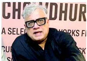
ડીએમસી રાજ્યસભા સાંસદ ડેરેક ઓ'બ્રાયને દ્વારા મુખ્ય ચૂંટણી કમિશનરને લખેલા પત્રમાં ઉલ્લેખ કરવામાં આવ્યો હતો કે રોય નંદીગ્રામમાં બીડીઓ તરીકે કામ કરતા હતા અને ભાજપના નેતા સુવેન્દુ અધિકારીના 'નજીક'ના વ્યક્તિ છે. તેમણે

(એજન્સી) કોલકાતા, તા.૨૬ તૃણમૂલ કોંગ્રેસ (TMC)એ બુધવારે ભવાનીપુર મતવિસ્તારમાં રિટર્નિંગ ઓફિસર (RO) તરીકે સુરજીત રોયની નિમણૂક સામે ભારતીય ચૂંટણી પંચ (ECI)ને લેખિત ફરિયાદ આપી હતી. TMCએ આરોપ લગાવ્યો હતો કે રોય વિરોધ પક્ષના નેતા અને ભારતીય જનતા પાર્ટી (BJP) ભવાનીપુરના ઉમેદવાર સુવેન્દુ અધિકારીના 'નજીક' ના વ્યક્તિ છે. ઉલ્લેખનીય છે કે, મંગળવારે ઉત્તર બંગાળ જતા પહેલા, મુખ્યમંત્રી મમતા બેનરજીએ કોઈનું નામ લીધા વિના, રોય 'દેશદ્રોહી'ની 'નજીક' હોવાની ફરિયાદ કરી હતી.