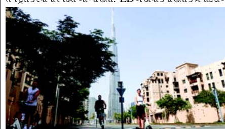
સદ્દાબાજ પેનલો દ્વારા મેળવેલા નફાનો આશરે ૭૦-૭૫ ટકા હિસ્સો જાળવી રાખ્યો હતો, જ્યારે બાકીનો હિસ્સો સદ્દાબાજ કામગીરીનું સંચાલન કરતા પેનલ ઓપરેટરોમાં વહેંચવામાં આવ્યો હતો. ત્યારબાદ, આ ગેરકાયદેસર ભંડોળ હવાલા ચેનલો, ક્રિટોકરન્સી વ્યવહારો અને જટિલ નાણાકીય સ્તરીકરણ પદ્ધતિઓ દ્વારા ભારતની બહાર ટ્રાન્સફર કરવામાં આવ્યું હતું, અને અંતે UAE અને ભારતમાં ઉચ્ચ મૂલ્યની સ્થાવર અને સ્થાવર સંપત્તિઓમાં રોકાણ કરવામાં આવ્યું હતું.