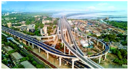
જાહેરાત કરતી વખતે, ફડણવીસે ડિસેમ્બર ૨૦૨૪માં કહ્યું હતું કે ‘ત્રીજી મુંબઈ’ “મુંબઈ કરતાં ત્રણ ગણું મોટું અને દેશની આગામી વ્યાપારી રાજધાની” હશે. ગયા મહિને તેના બજેટની જાહેરાત કરતી વખતે, MMRDAએ અટલ સેતુ પ્રભાવ વિસ્તારમાં આવેલા કર્નાલા-સાઈ-ચિનર (KSC) ન્યુ ટાઉનમાં આ ત્રીજી મુંબઈના શહેરી વિકાસ માટે એક વિઝન રજૂ કર્યું હતું. વિવિધ પ્રોજેક્ટ્સ માટે ફાળવવામાં આવેલા ૪,૬૦૦ કરોડ રૂપિયામાંથી, MMRDAએ ત્રીજી મુંબઈ પ્રોજેક્ટ માટે ૪,૦૦૦ કરોડ રૂપિયા ફાળવ્યા છે. આ બજેટ દસ્તાવેજ મુજબ, ‘મુંબઈ ૩.૦’નો ઉદ્દેશ્ય સંકલિત આર્થિક, રહેણાંક અને રોજગાર ઈકોસિસ્ટમ સાથે આયોજિત શહેરી નોડ્સ બનાવવાને મુંબઈમાં બીડ ઓછી કરવાનો છે. મુંબઈ મેટ્રોપોલિટન રિજનમાં KSC ન્યુ ટાઉન આગામી મુખ્ય શહેરી સીમા તરીકે સ્થિત છે, જેનો હેતુ રોકાણ આકર્ષવા અને રોજગારીનું સર્જન કરવાનો છે, સાથે સાથે નજીકના જિલ્લાઓમાં માળખાગત વિકાસને ટેકો આપવાનો છે. અટલ સેતુના નિર્માણથી મુંબઈ અને નવી મુંબઈ વચ્ચેના મુસાફરીના સમયમાં નોંધપાત્ર ઘટાડો થયો છે, અને હવે તેમાં ૨૦ મિનિટથી થોડો વધુ સમય લાગે છે. આ કનેક્ટિવિટી નવી તકોનું સર્જન કરશે. આ પુષ્કળિ સામે, MMRDAએ રાયગઢ જિલ્લાના પનવેલ, પેન અને ઉરણ તાલુકામાં ૩૨૩.૪૪ ચોરસ કિલોમીટર વિસ્તારમાં વિકાસની દેખરેખ માટે નવાનગર (ન્યુ ટાઉન) ડેવલપમેન્ટ ઓથોરિટીની નિમણૂક કરી છે. રાયગઢ પેન ગ્રોથ સેક્ટર માટે રૂ. ૫૦૦ કરોડ અને ખારવાળા ઈન્ડિગો (બિઝનેસ પાર્ક માટે રૂ. ૧૦૦ કરોડ જેવી નાની ફાળવણી, મુંબઈના સંતુલ્ન કોરથી આગળ પ્રાદેશિક વિસ્તરણના નવા તબક્કાના કાર્યકર્તા થવાનો સંકેત છે.