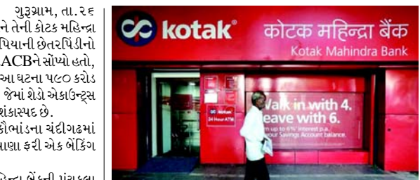
પંચકુલા મ્યુનિસિપલ કોર્પોરેશનને કોટક મહિન્દ્રા બેંકની પંચકુલા શાખામાં રાખવામાં આવેલી તેની ફિક્સડ ડિપોઝિટ રિસિપ્ટ્સ (FDR)માં લગભગ ૧૫૦ કરોડ રૂપિયાની વિસંગતતાઓ શોધી કાઢી છે, જ્યારે નાગરિક સંસ્થાએ બેંકને આવા એક FDRની પરિપક્વતા પર ભંડોળ ટ્રાન્સફર કરવાનું કહ્યું ત્યારે જ ગેરરીતિઓ સામે આવી હતી.

(એજન્સી) ગુરૂગ્રામ, તા. ૨૬ હરિયાણાના પંચકુલા મ્યુનિસિપલ કોર્પોરેશનને તેની કોટક મહિન્દ્રા બેંક ફિક્સડ ડિપોઝિટમાં લગભગ ૧૫૦ કરોડ રૂપિયાની છેતરપિંડીનો પર્દાફાશ કર્યો હતો. રાજ્ય સરકારે આ કેસ SV&ACBને સોંપ્યો હતો, જેણે FIR નોંધી હતી અને તપાસ શરૂ કરી હતી. આ ઘટના ૫૮૦ કરોડ રૂપિયાના IDFC ફર્સ્ટ બેંક કૌભાંડને અનુસરે છે, જેમાં શેડો એકાઉન્ટ્સ અને બનાવટી દસ્તાવેજો જેવી પદ્ધતિઓ ધોળાં ધોળાં શંકાસ્પદ છે. ૫૮૦ કરોડ રૂપિયાના IDFC ફર્સ્ટ બેંક કૌભાંડના ચંદીગઢમાં ધમાલ મચાવ્યાના થોડા અઠવાડિયા પછી હરિયાણા ફરી એક બેંકિંગ છેતરપિંડીનો ભોગ બન્યું છે.