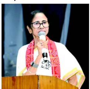
નથી. આ સંપૂર્ણપણે આપણા લોકશાહી અને બંધારણને બચાવવા, સુરક્ષિત રાખવા માટે છે.” તેણી કોલકાતા એરપોર્ટ પર પત્રકારો સાથે વાત કરી રહ્યા હતા. તૃણમૂલ કોંગ્રેસના અધ્યક્ષની ટિપ્પણીનું તાત્કાલિક કારણ ચૂંટણી પંચના એક સંદેશનું પ્રસારણ હતું જેમાં ભાજપના કેરળ એકમની સીલ હતી, જેના કારણે ભાદમાં નિર્વાચન સદન તરફથી સ્પષ્ટતા કરવામાં આવી. જ્યારે પંચે આ ઘટનાને કારકુની ભૂલ ગણાવી હતી, ત્યારે મમતા બેનરજીએ આ સમજૂતીને ફગાવી દીધી હતી અને ચૂંટણી પંચના નિવેદનને

(એજન્સી) કોલકાતા, તા.૨૬ પશ્ચિમ બંગાળના મુખ્યમંત્રી મમતા બેનરજીએ મંગળવારે દેશભરના બિન-એનડીએ પક્ષોને એક થવા કહ્યું હતું. મતભેદોને બાજુ પર રાખીને ભારતીય જનતા પાર્ટી (ભાજપ) અને ચૂંટણી પંચ વચ્ચેના “અપવિત્ર ગઠબંધન”નો પ્રતિકાર કરવા વિનંતી કરી, જેનો હેતુ ભારતમાં એક પક્ષીય શાસન માટે માર્ગ મોકળો કરવાનો છે. “તમે જમણેરી છો કે ડાબેરીપ ચાલો તે ભૂલી જઈએ. હું બધાને વિનંતી કરું છું કે તેઓ એકસાથે આવે અને સરમુખત્યારશાહી, આપબુદ્ધશાહી સામે લડે. કેન્દ્ર અને તેની એજન્સીઓના એક પક્ષીય શાસનનો વિરોધ કરે.” ધટેલિગ્રાફના અહેવાલ મુજબ, બંગાળના મુખ્યમંત્રીએ કહ્યું, તેણીએ આગળ કહ્યું: “હું તેમને રાજીના હિતમાં વિરોધ કરવા અને મુક્ત અને ન્યાયી ચૂંટણી સુનિશ્ચિત કરવા વિનંતી કરું છું. ચાલો આપણા રાજકીય મતભેદો ભૂલી જઈએ. તમારે મારી સાથે ઊભા રહેવાની જરૂર નથી, પરંતુ હવે લોકોની સાથે ઊભા રહેવું સૌથી મહત્વપૂર્ણ છે. હું કોઈપણ પક્ષ પાસેથી કોઈ (ચૂંટણી) સમર્થન માંગી રહી