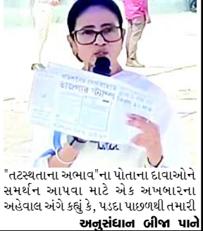
"તટસ્થતાના અભાવ"ના પોતાના દાવાઓને સમર્થન આપવા માટે એક અખબારના અહેવાલ અંગે કહ્યું કે, પડદા પાછળથી તમારી અનુસંધાન બીજા પાને

"ગુપ્ત વાત જાહેર થઈ ગઈ છે" : બંગાળના મુખ્યમંત્રી મમતા બેનરજીએ ECના પત્રમાં ભાજપની સીલના વિવાદ પર ચૂંટણી પંચ પર પ્રહારો કર્યા આ ઘટનાક્રમ ચૂંટણી પંચની ચૂંટણી યોજવામાં નિષ્પક્ષતા પર ગંભીર પ્રશ્નાર્થ યિદ્ધ છે એવો આરોપ લગાવતા, તેમણે તમામ પક્ષોને એક થવા અને ભારતમાં એક પક્ષીય શાસન લાદવાના પ્રયાસ સામે લડવા વિનંતી કરી છે (એજન્સી) કોલકાતા, તા. ૨૪ પશ્ચિમ બંગાળના મુખ્યમંત્રી મમતા બેનરજીએ મંગળવારે આરોપ લગાવ્યો કે ચૂંટણી પંચના સંદેશાવ્યવહાર પર ભાજપનો કથિત રબર સ્ટેમ્પ શંકા વિના સાબિત કરે છે કે કમો પક્ષ પાછળથી ચૂંટણી નિરીક્ષકને નિયંત્રિત કરી રહ્યો છે. માર્ચ ૨૦૧૮માં ચૂંટણી પંચના એક પત્ર પર ભાજપ કેરળ એકમની સીલ મળી આવ્યા બાદ સોમવારે રાજકીય વિવાદ શરૂ થયો હતો. તેમણે કહ્યું કે, ચૂંટણી પંચના નોટિફિકેશન પર ભાજપની આ રબર સ્ટેમ્પથી હવે સ્પષ્ટ થઈ ગયું છે કે પાછળથી કોષ કમિશન ચલાવી રહ્યું છે. બિલાડી કોષણમાંથી હવે સ્પષ્ટ થઈ ગયું છે. તેમણે વિધાનસભા ચૂંટણીઓ યોજવામાં ચૂંટણી પંચના